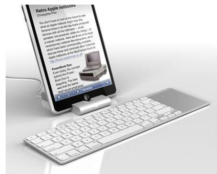
'tablet' con teclado aparte